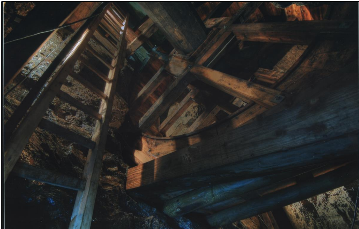
Bildrechte: Zinngrube Ehrenfriedersdorf

Zu Beginn war es eher Fluch als Segen: WASSER bietet noch immer viele Gefahren für Bergleute. Kluge Köpfe und geschickte Hände ermöglichten jedoch, dass es zum Segen wurde: durch den Bau von Radpumpen konnten die Bergleute immer tiefer schürfen.